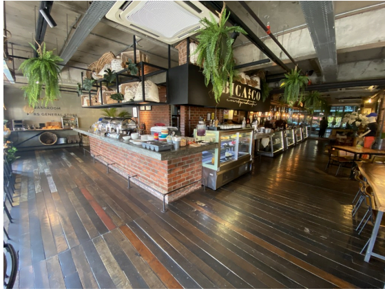
工业混搭风的早餐厅