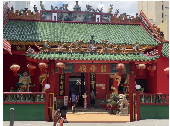
茨场街关帝庙，和印度寺庙几乎在一起。