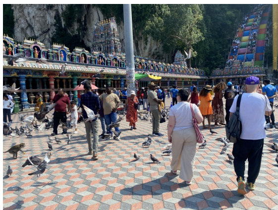
门前广场上真的是挤满了鸽子，飞起来能遮蔽天日。