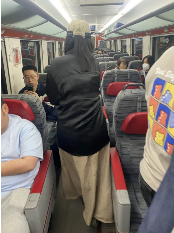
车内布局1+2。这个车型和座椅非常熟悉？没错这是中国中车CRRC产的车。