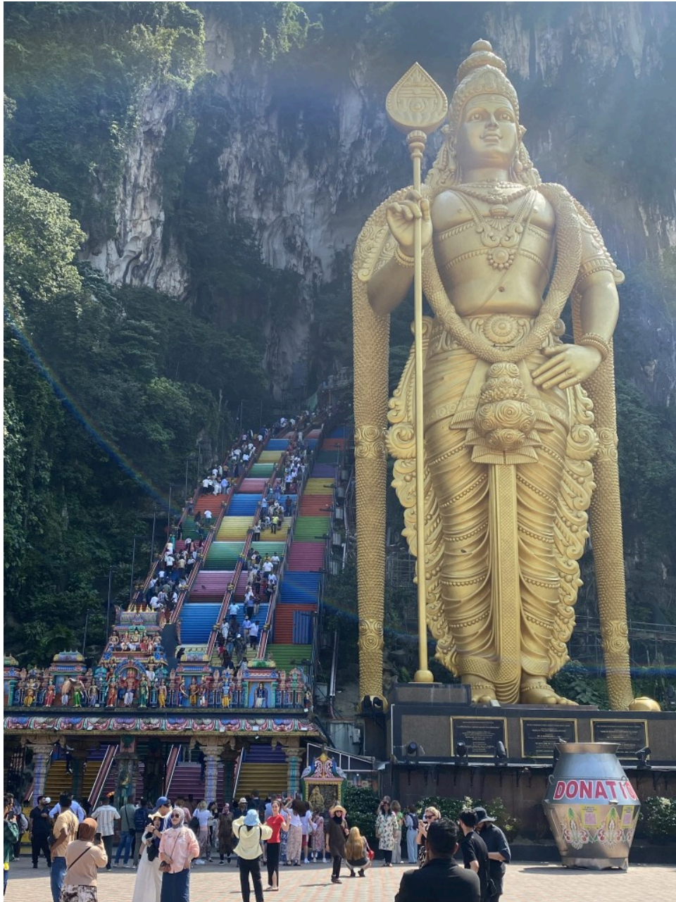
巨大神像的魄力。顺便一提这个台阶真的很陡很窄。