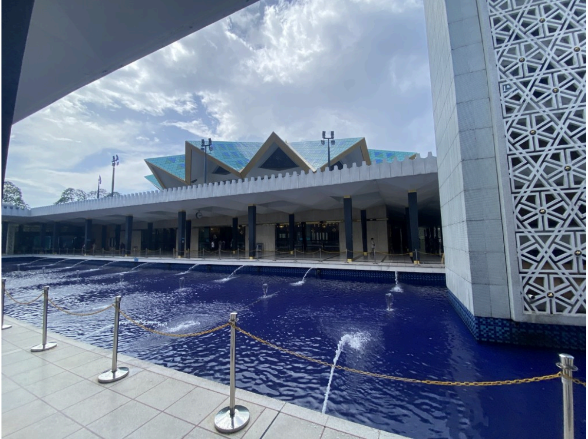
尖锐星形的顶是特色