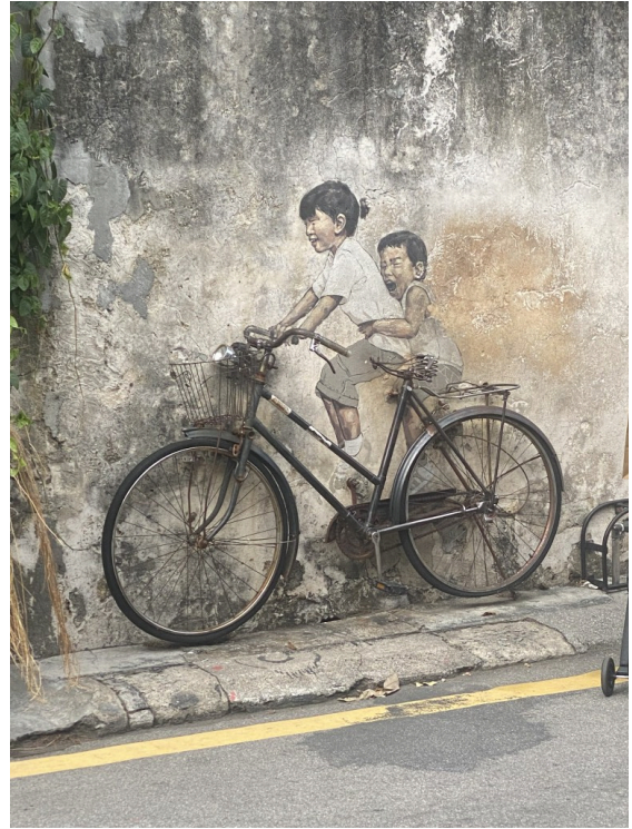
这个自行车不是画的