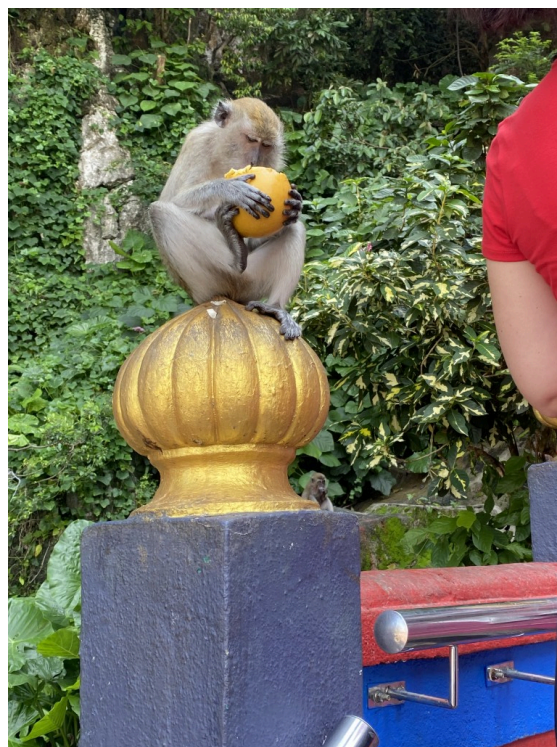
肆无忌惮的猴哥。还有人的防晒霜被猴子抢走了。