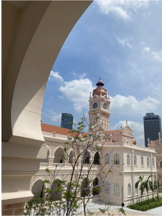
苏丹阿都沙末大厦。建于 19 世纪的宏伟政府大楼，设有铜制圆顶，以及拥有重达 1 吨的大钟的大钟楼（Google）。