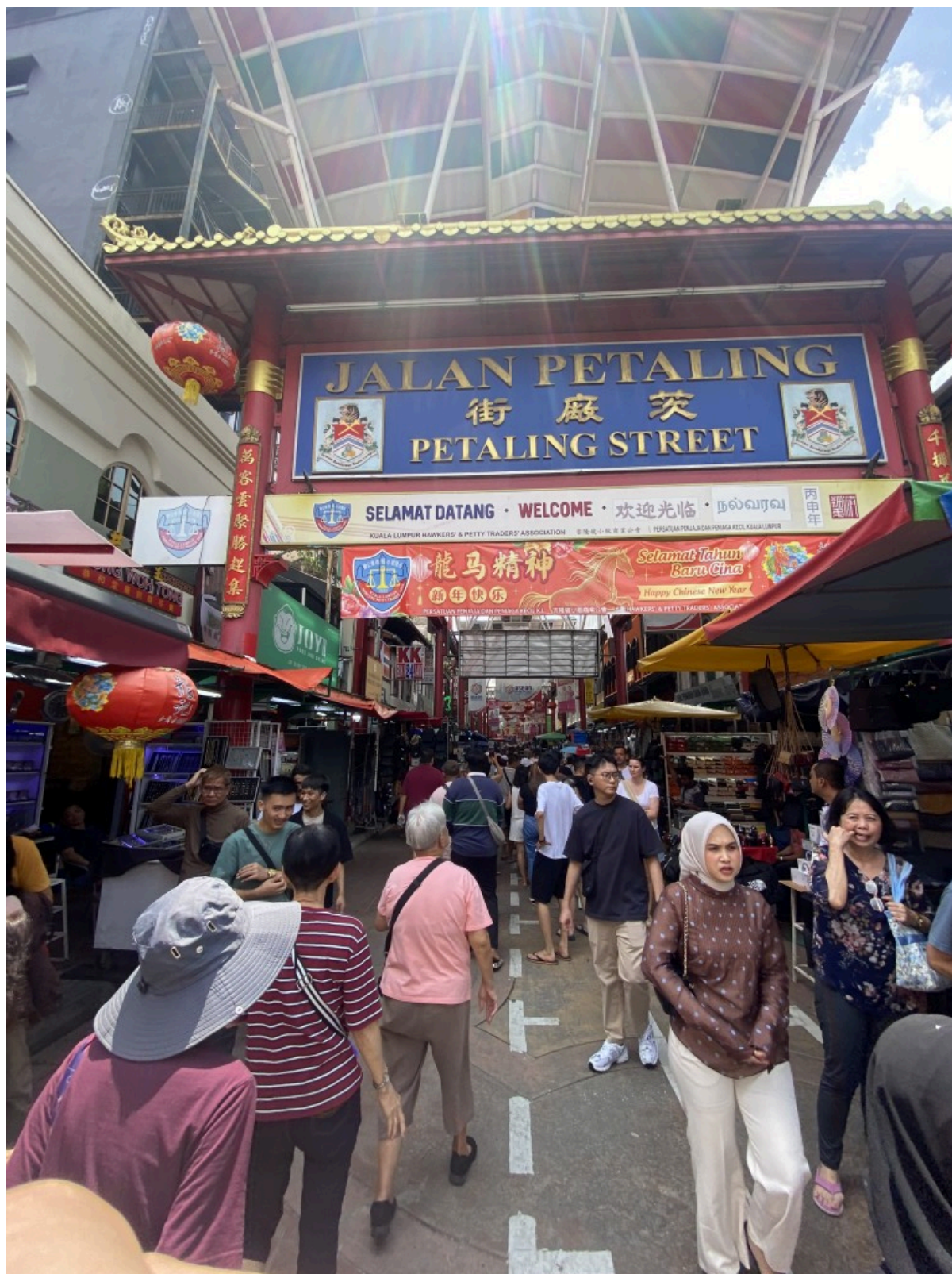
Jalan Petaling。华人街，里面全是商店，卖的也没有什么特色，因为游人很多商家也很多很杂乱。我个人不是很喜欢 😞 不过应该有人会喜欢这种热闹充满小市场气息的感觉吧