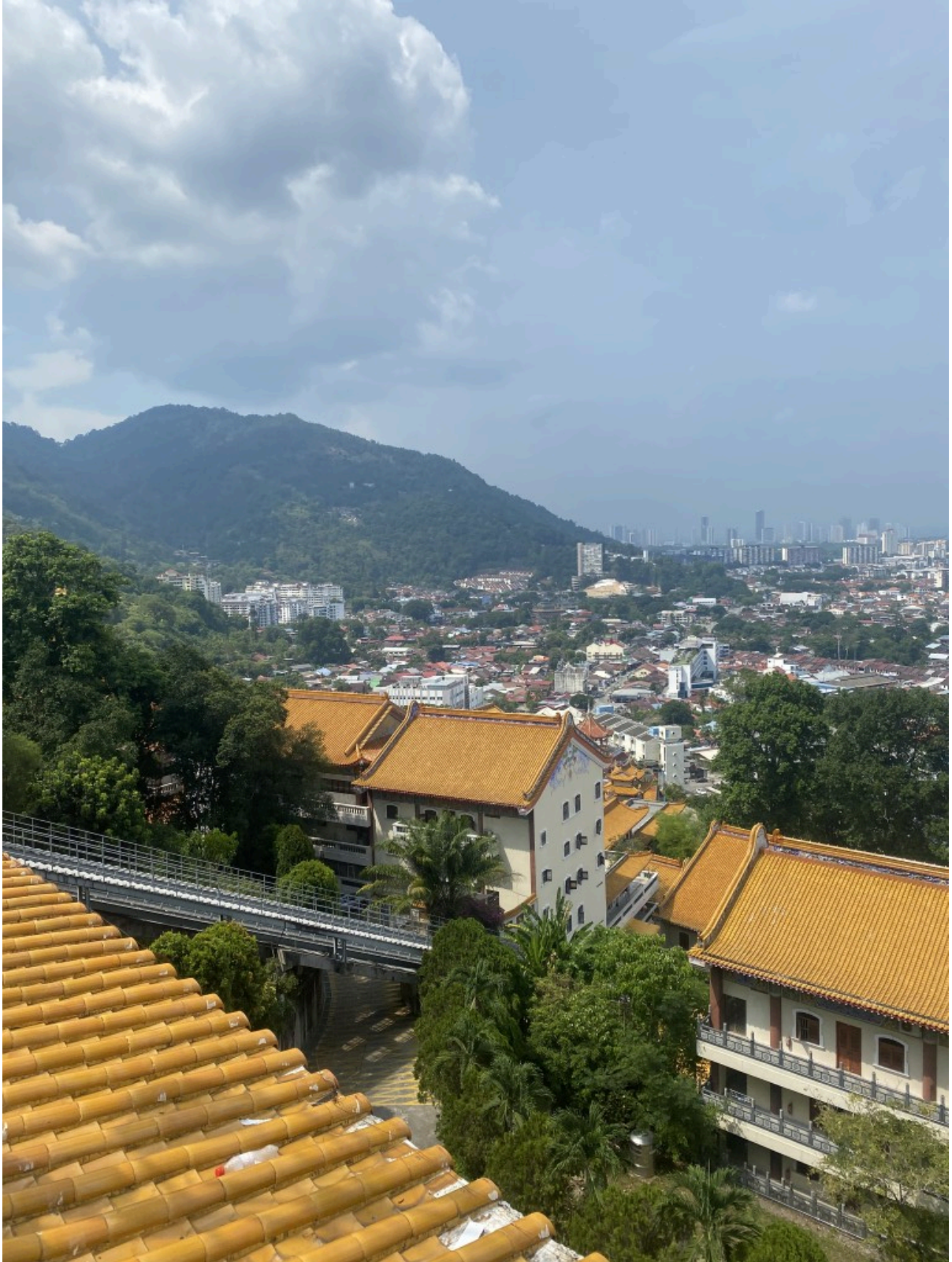
山顶景象，左侧即为倾斜电梯，前方即为升旗山