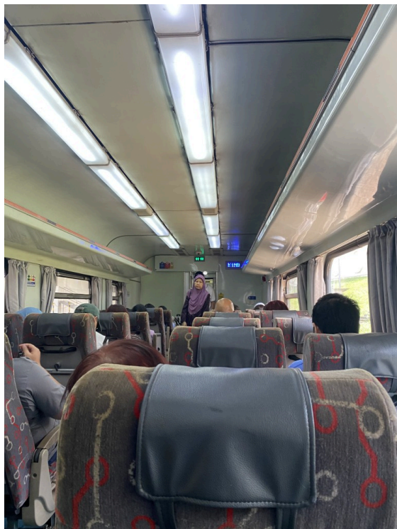
Commuter列车内部，座位类似一等座？

新山是离新加坡最近的口岸，有着新加坡后花园之称，作为进入马来西亚的第一站再合适不过了。通过非常简易的出入境手续，乘坐至今仍然是柴油车的Commuter进入新山，5分钟后就到达了市中心JB Sentral站。