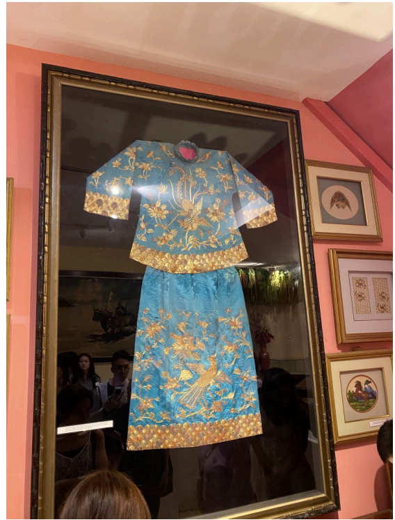
我忘了是啥衣服了，反正放这了ε=ε=ε= Γ(° □ ° ;)_└