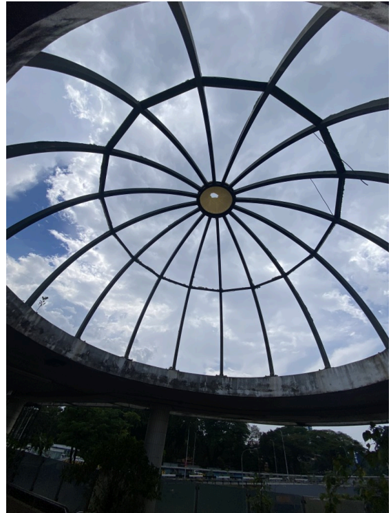
不知道为什么露天的穹顶，是不是玻璃碎了形成的呢？