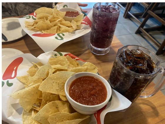
饮料可以续杯大赞！而且这么大的杯子喝起来真的很爽！