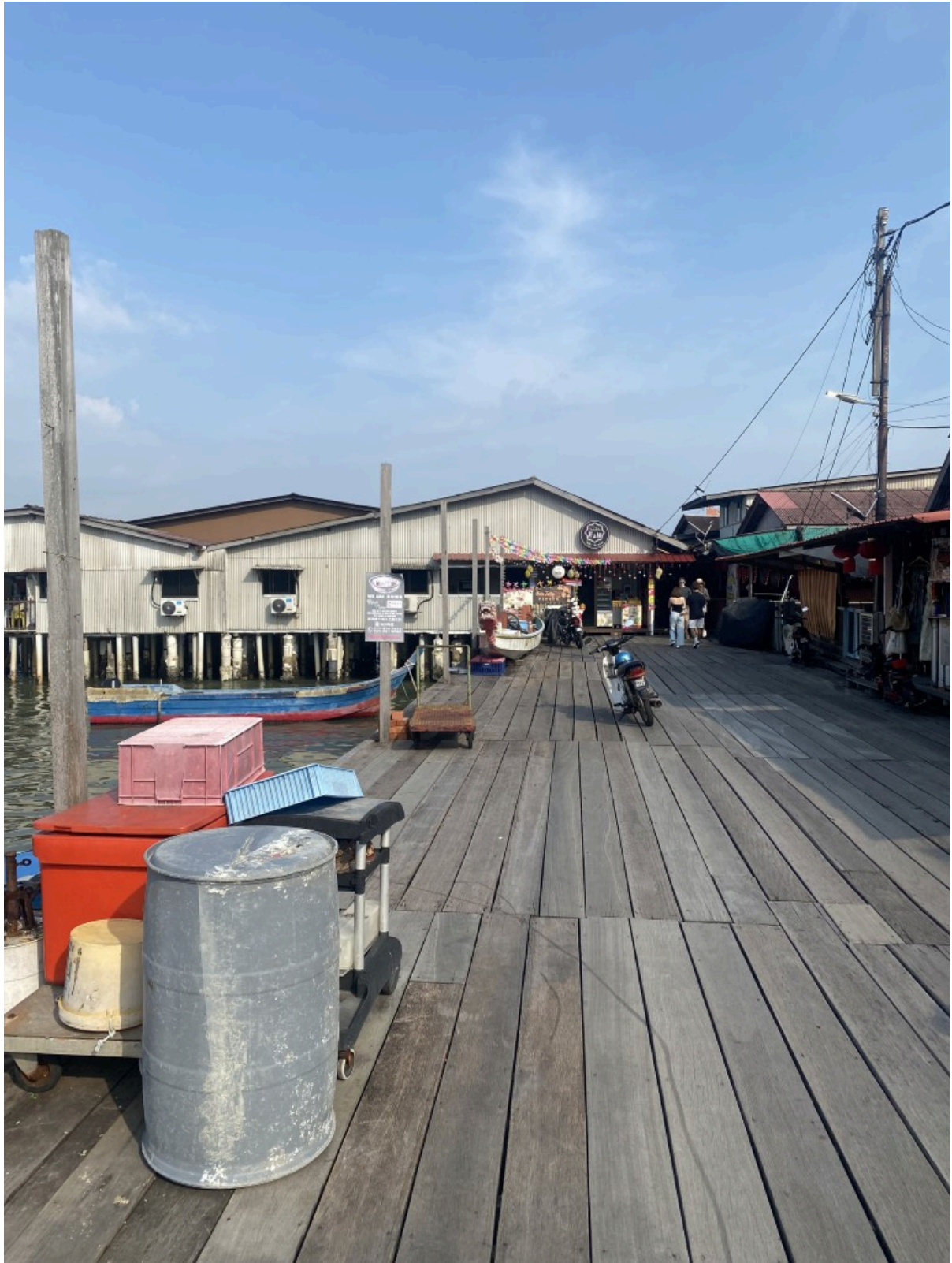
木板下面就是水面，走在上面嘎吱嘎吱的有点心惊胆战，特别是越深入水里木板越窄。