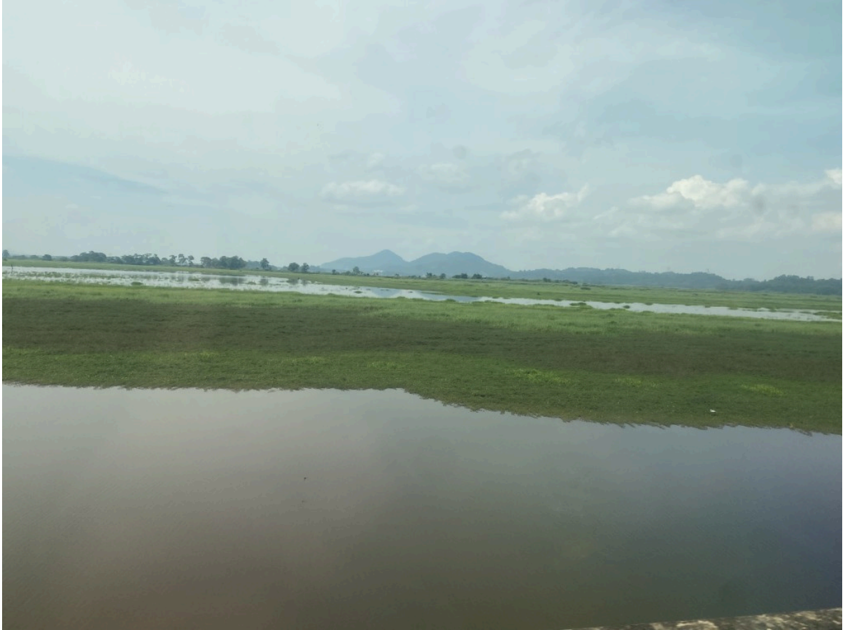
Kolam Bukit Merah (红山水池?), 列车行驶在水上