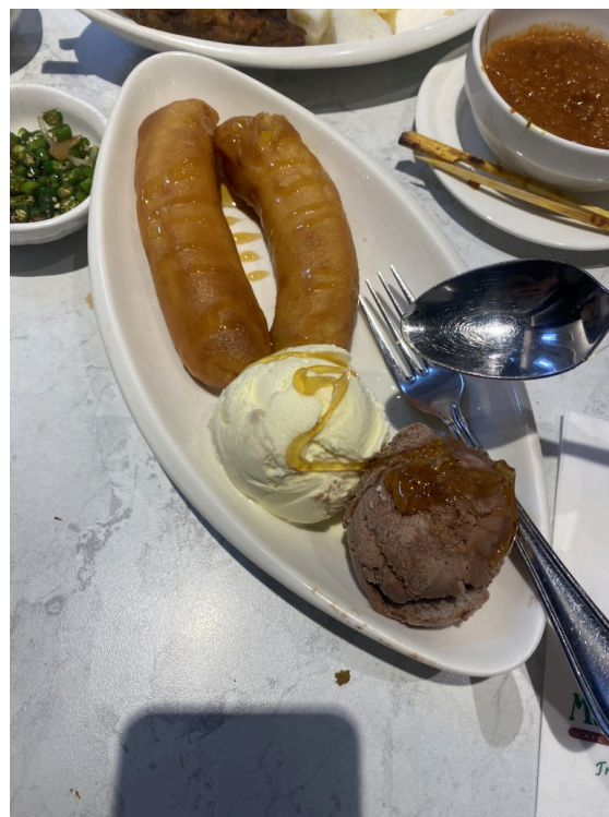
晚餐，娘惹菜，有satay，炒饭等。是某大众点评数一数二的高分娘惹连锁餐饮，但是上菜慢、口味普通，性价比也不高。很不推荐。