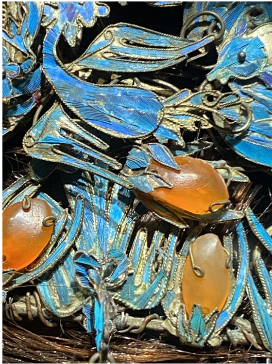
点翠的头饰。用翠鸟羽毛镶嵌于金属底座上，是一种十分贵族、美丽但是残忍的（传统工艺被认为需要从活鸟身上拔取羽毛）工艺品。