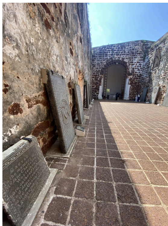
旧教堂里面展示了许多历史碑迹。

旧教堂位于Bukit Melaka上，可以俯瞰远处的海和城市（但是拍的感觉一般所以没放照片）