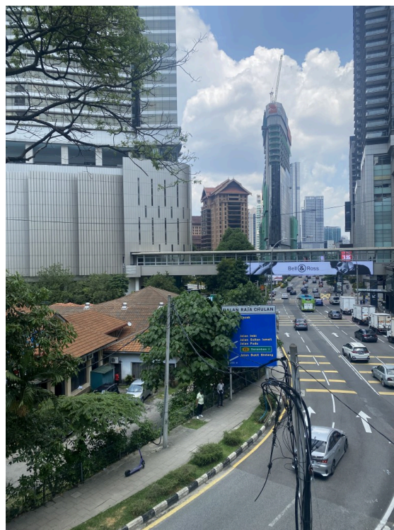
总感觉城市中总是突然冒出来格格不入的房子。