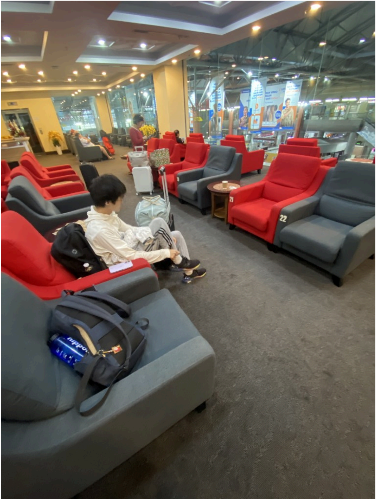
休息室 Ruby Lounge，外面能够直接看到KTM Kommuter的站台和楼下蔗民。休息室里免费的饮料茶包、milo包、咖啡包，还有免费的面包和粽子啥的。休息室里大多数都是外国人