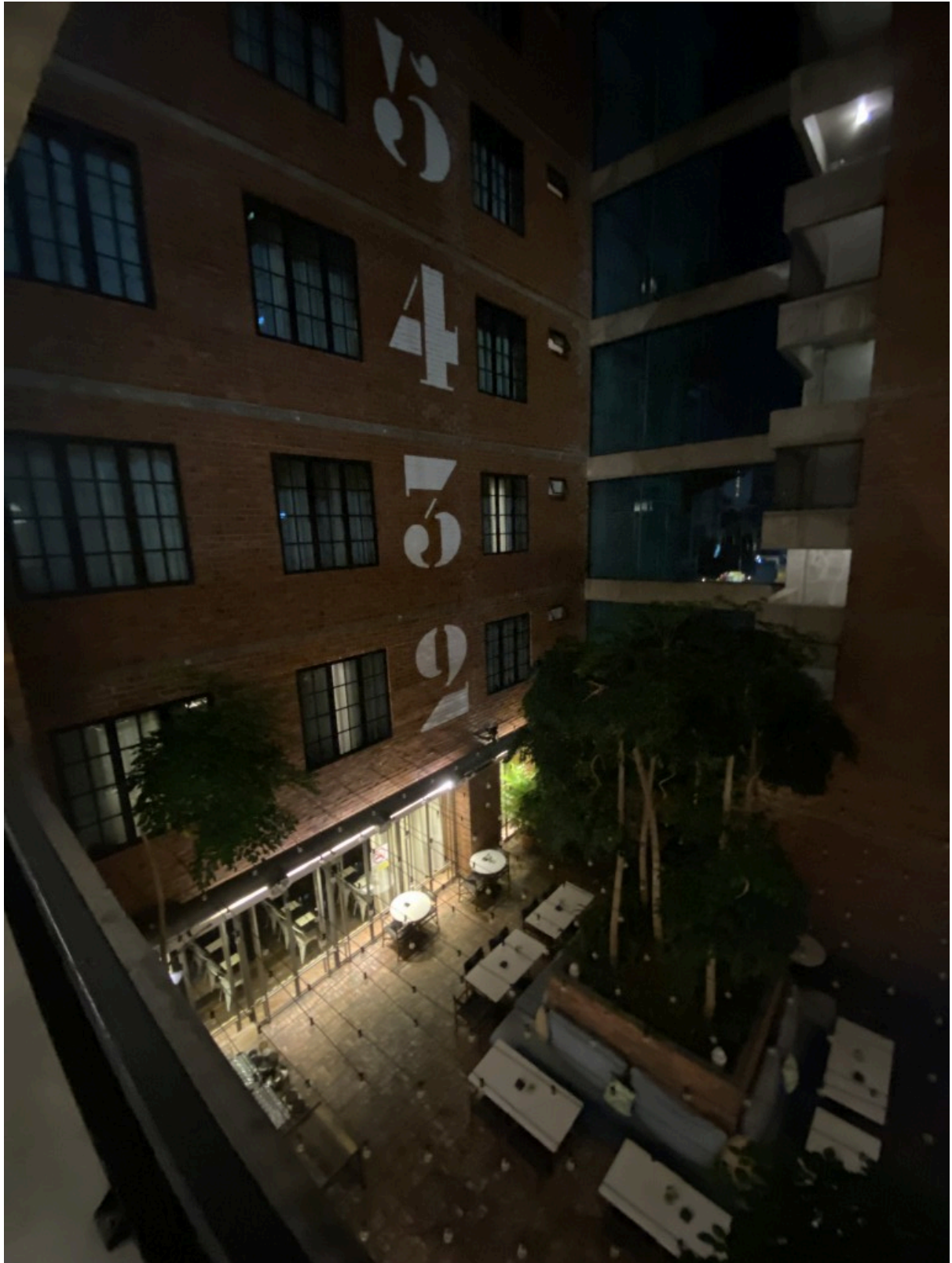
酒店设计是一个U形，中间是咖啡厅