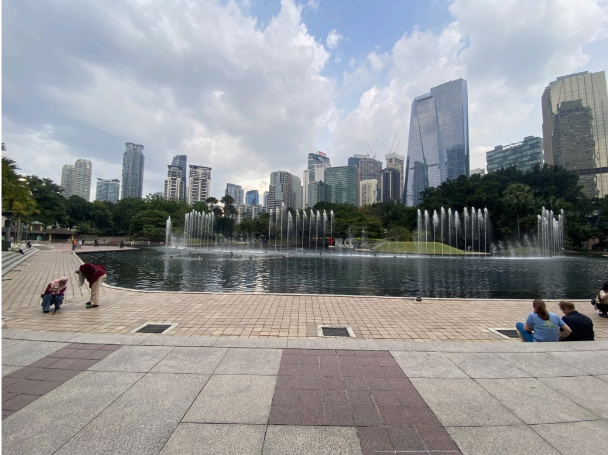
KLCC门前的喷泉。晚上会有声光表演。表演平凡，节拍一直因为水的延迟可能没算好，没怎么对上。