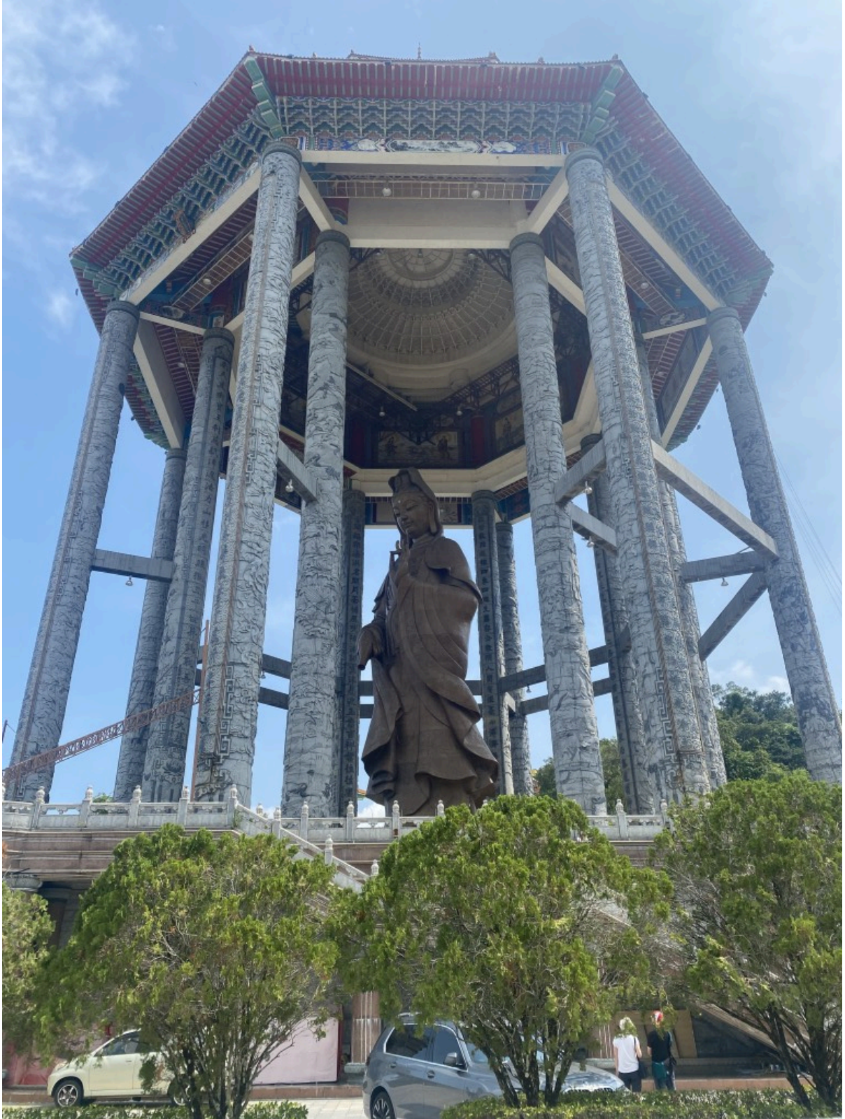
高达30多米、俯瞰众生的巨大青铜观音圣像。真的很壮观！