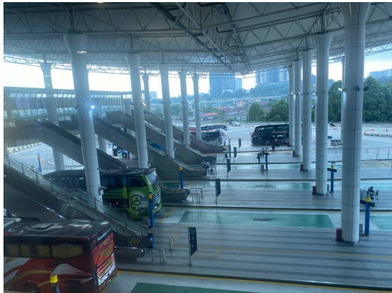
位于KL南侧的客运站。高铁站っぽい？