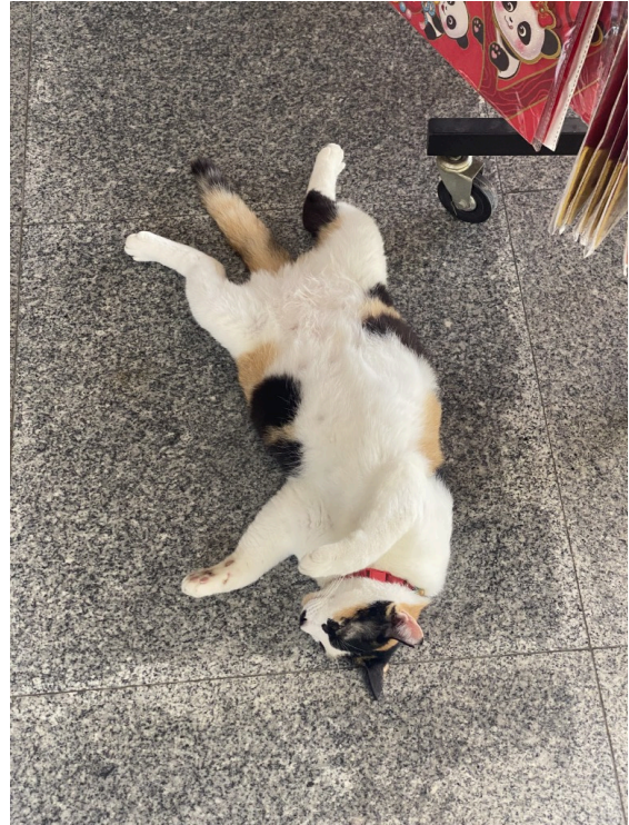
山顶上的店里的悠闲的猫猫~