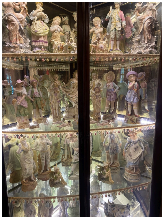
藏品之限量版玩偶