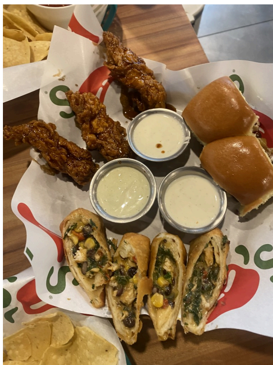
下面的是墨西哥春卷。