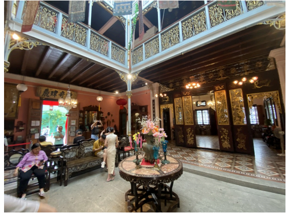
客厅，上面是没有顶的，方便采光