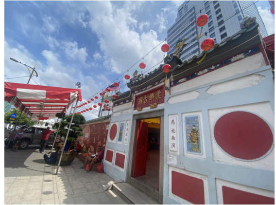
柔佛古庙，没有进去