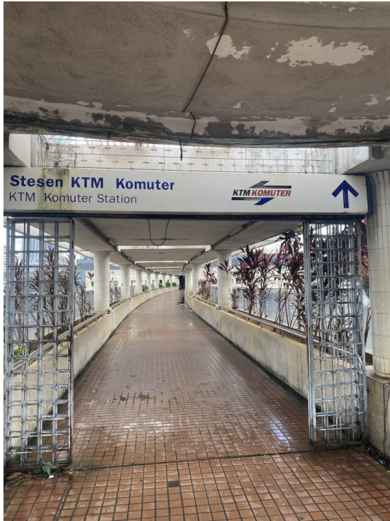
即将要进入“八号出口”世界般的车站入口

也叫做KL老火车站，虽然每天还是有不少列车停靠（Express也要停靠哦），但是最重要的车站已经变成了KL Sentral。感觉因为已经没人打理，在这里能够感受到恐怖电影般的氛围。周围的道路也是破破烂烂的，走在路上有感觉要被飞车党抢包的不安心感，一副“developed - 发达过城市”的模样。