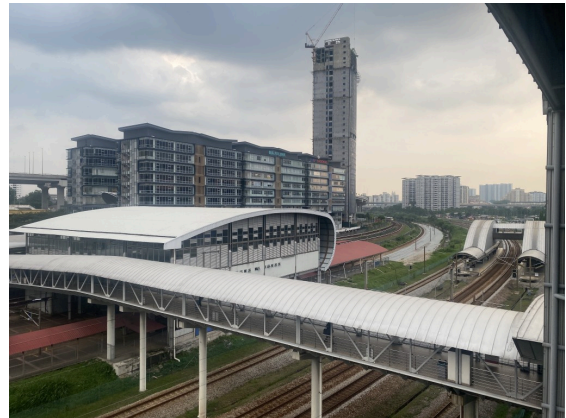
铁路，嘿嘿，还是复复线。说起来附近铁路很多，还有高架和铁路立交，有的看的。