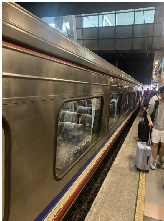
列车外观@JB Sentral，非常的东南亚风格的金属车厢