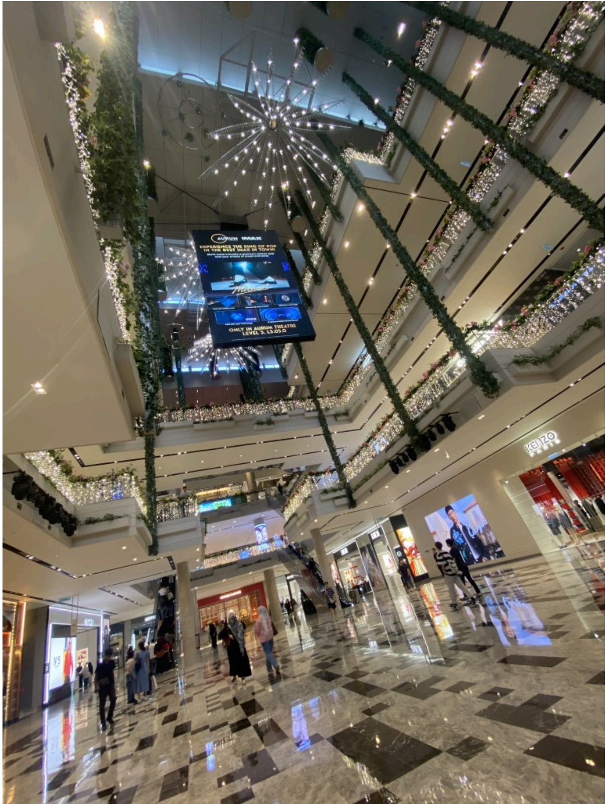
圣诞风? 的商场内部