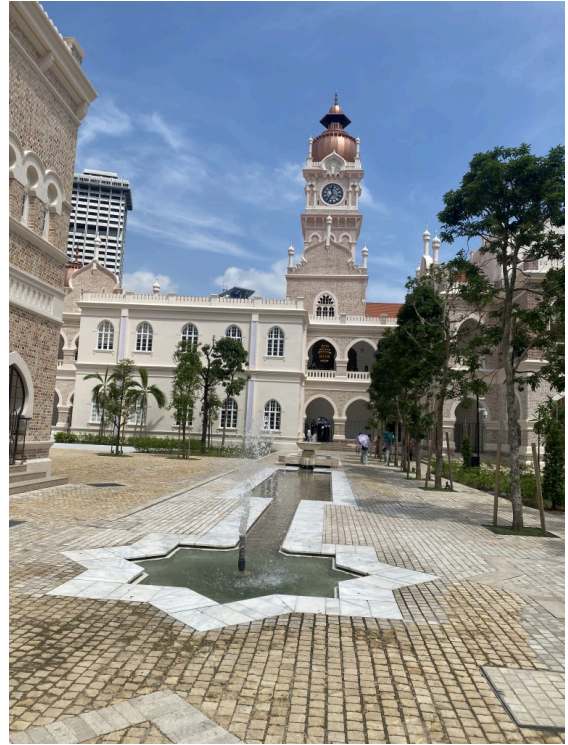
在设计上，我们能看到不仅有西洋风的建筑风格，还融合了穆斯林的元素。