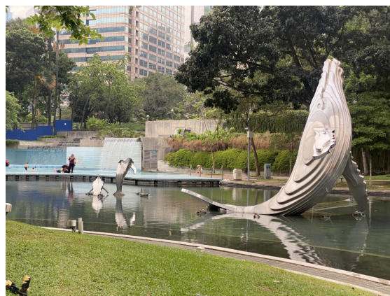
新加坡和马来西亚都很常见的水上乐园，还有大蓝鲸（）