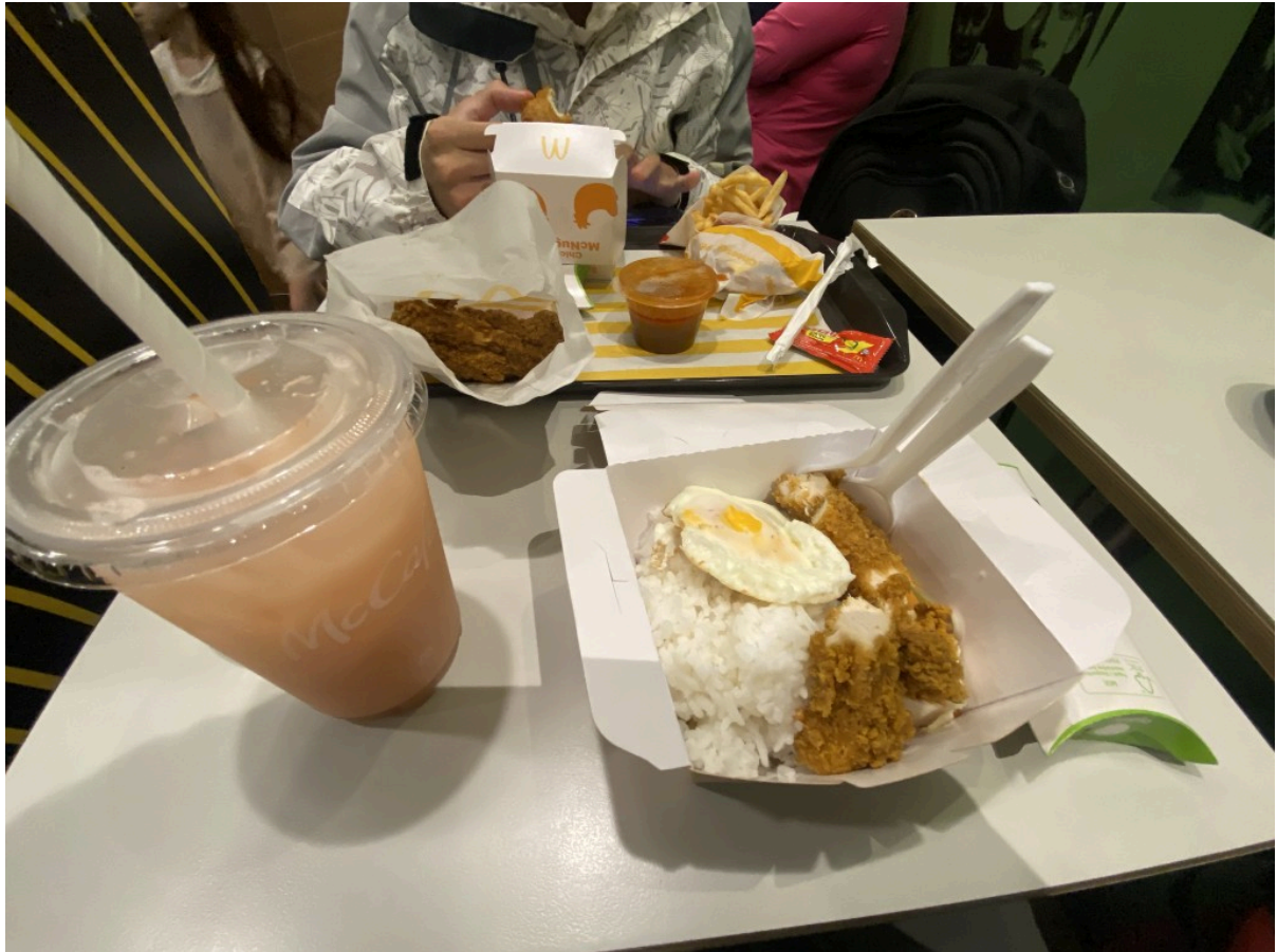
炸鸡饭评价：拉完了，啥都没有只有几块鸡和预制煎蛋