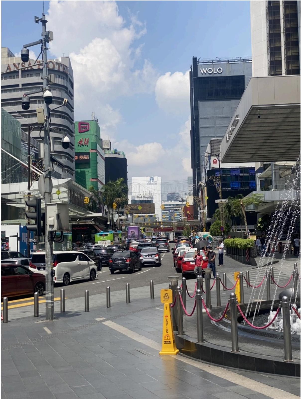
Pavilion门前，前面是铁路线，有点日本的感觉。很有大都市的风味。