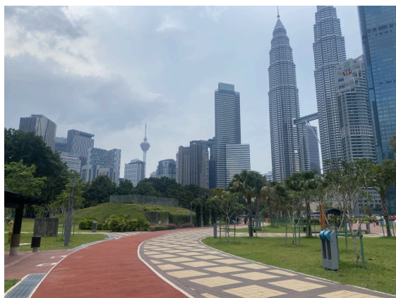
KLCC前的广场，能看到吉隆坡塔和石油双子塔。高楼衬着绿意盎然的城市公园大好き，充满了千禧科幻感。有点南京河西的感觉。