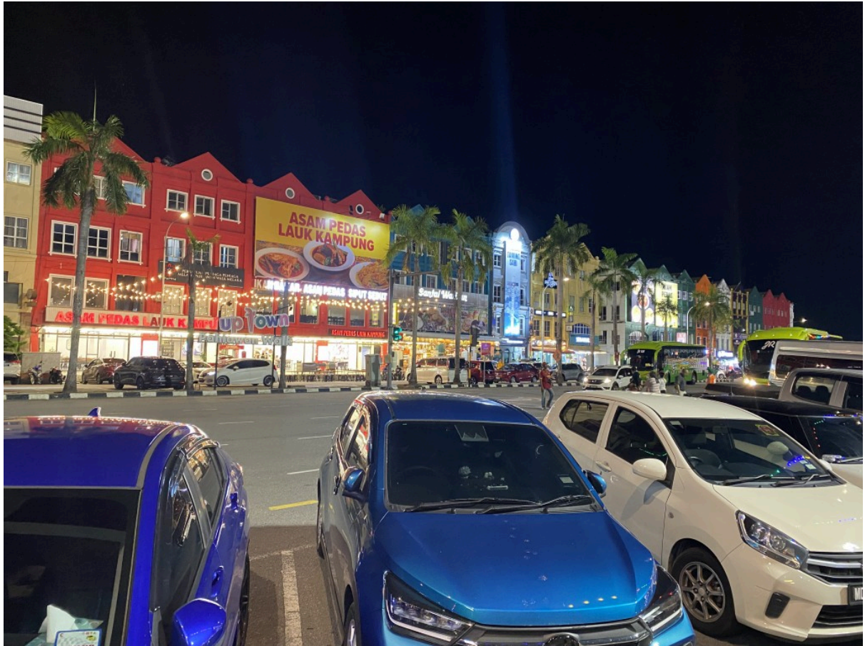
五颜六色的街道+热带树!