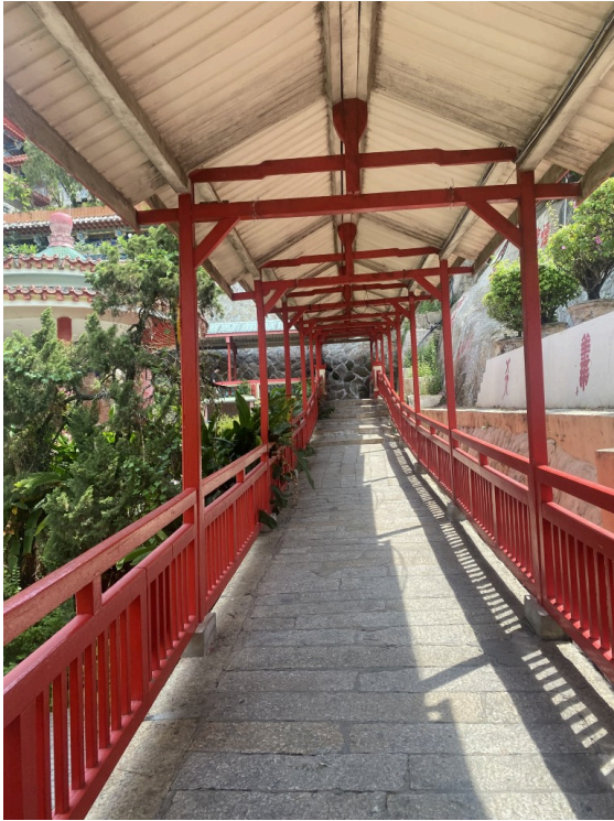
很有日本神社感的颜色