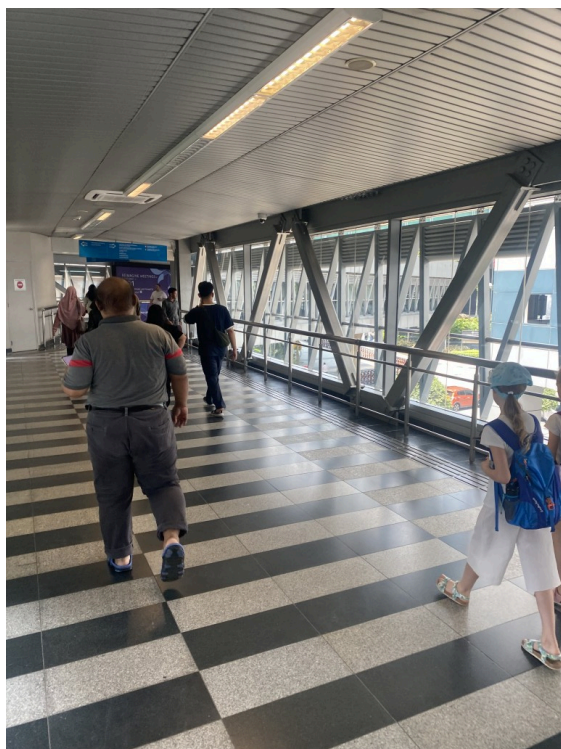
Pavilion和KLCC的联络桥，说是联络桥其实有数km长。在夏日炎炎和常年阴雨的马来西亚属于很地域特色的城市设计了，我很喜欢。