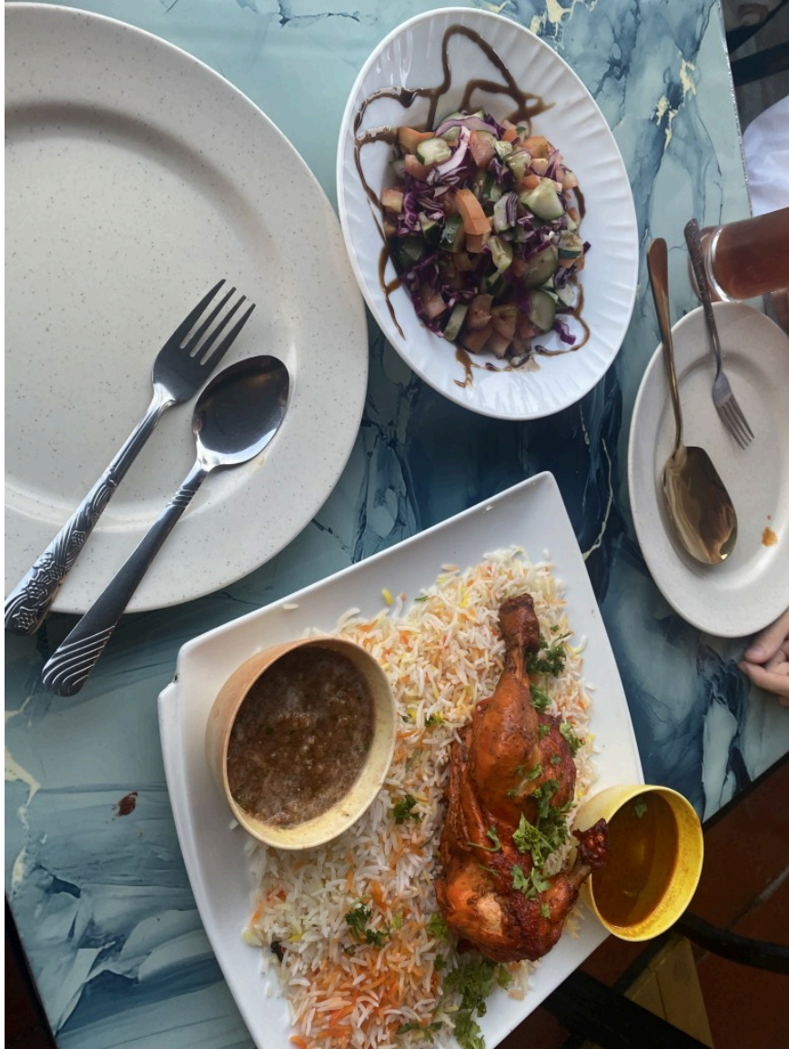
阿拉伯沙拉和某种咖喱饭