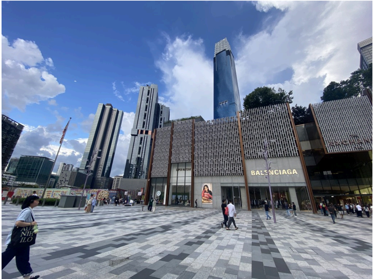
地标性的像灯塔？荧光棒？一样的建筑。在酒店里都能看到