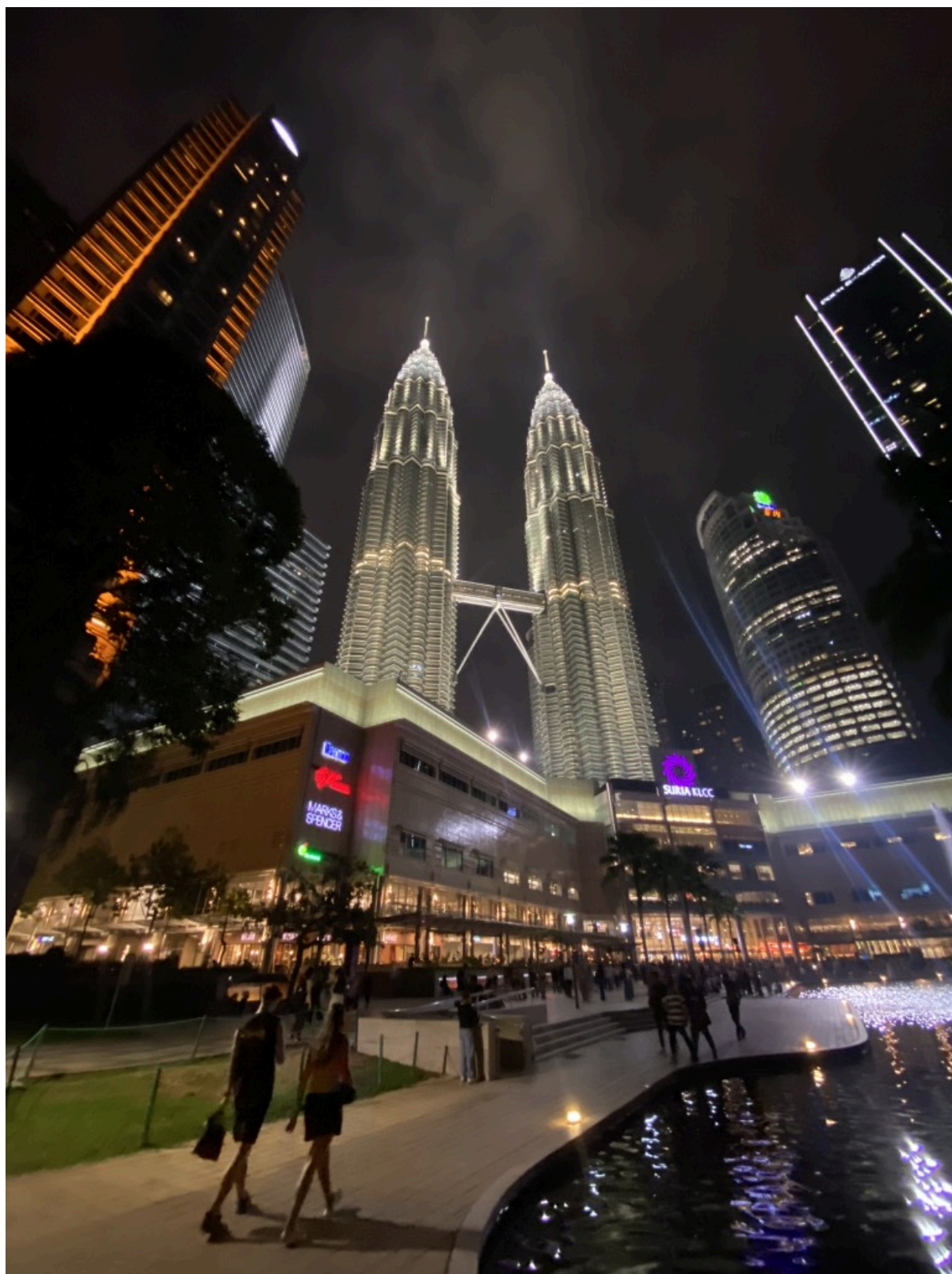
夜景。可惜没有马来西亚国旗配色版。