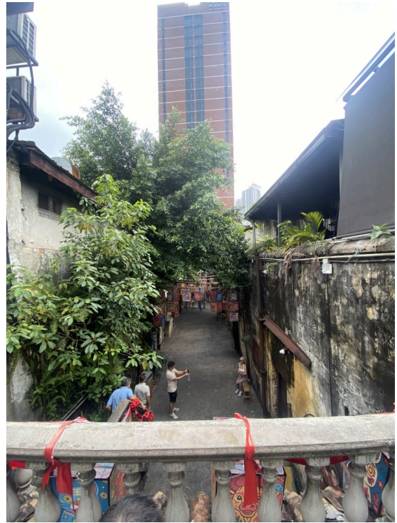
不知道哪里拐进去就能看到这个巷子。你跟我说在中国哪个老胡同我都信。