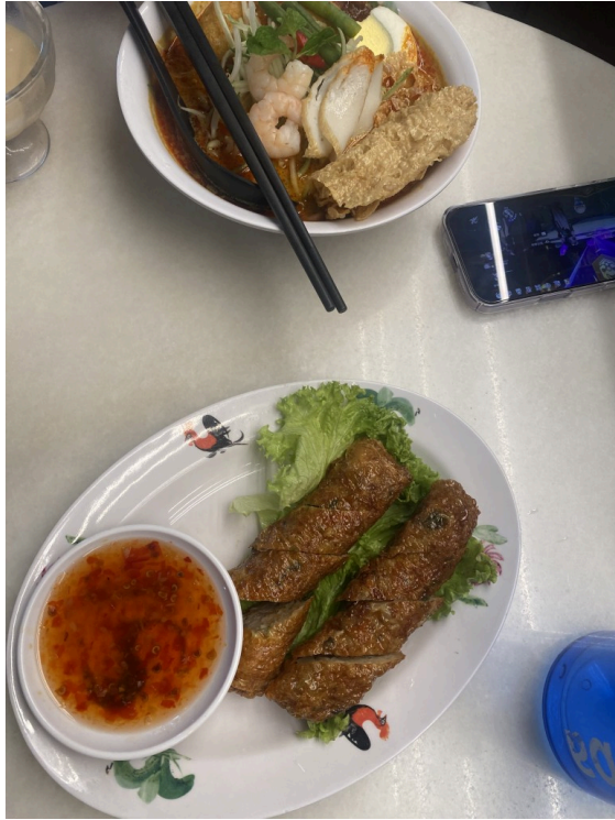
午饭Laksa和五香卷，娘惹菜