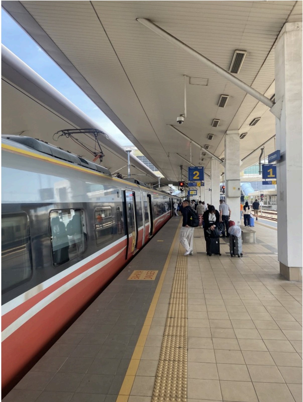
4个小时（+30分钟晚点）后到达终点站Butterworth黄油值