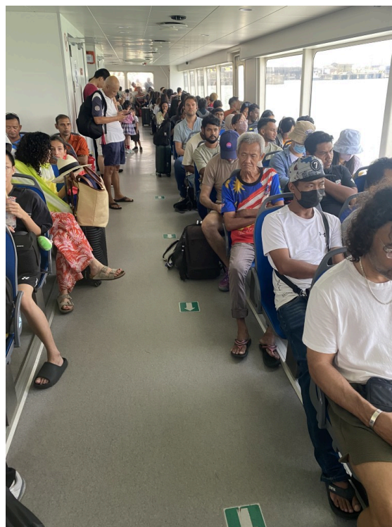
大部分人甚至连座位都没有只能站着