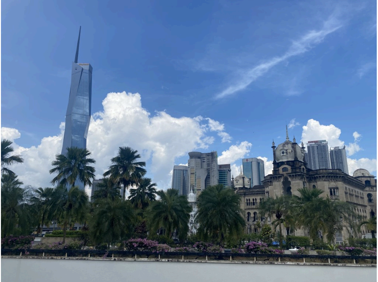
右侧是Keretapi Tanah Melayu Berhad (KTMB)，新老建筑的结合。天气不错~