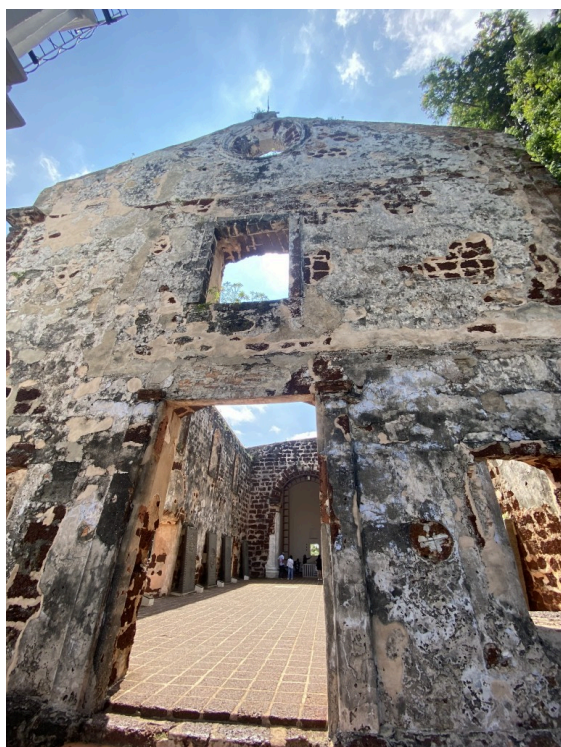
旧教堂。看着像战争遗骸，实际上也是。