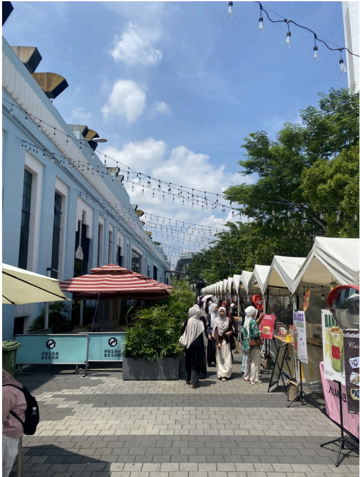
茨厂街 & 鬼仔巷