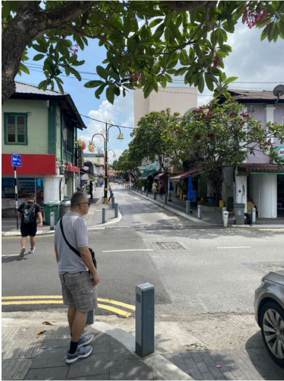
陈旭年街附近，这种小街有点像新加坡小印度，还是挺有市井风情的。