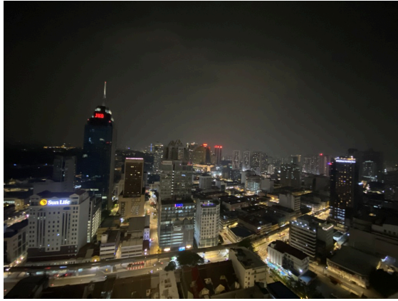
夜景，非常的繁华啊