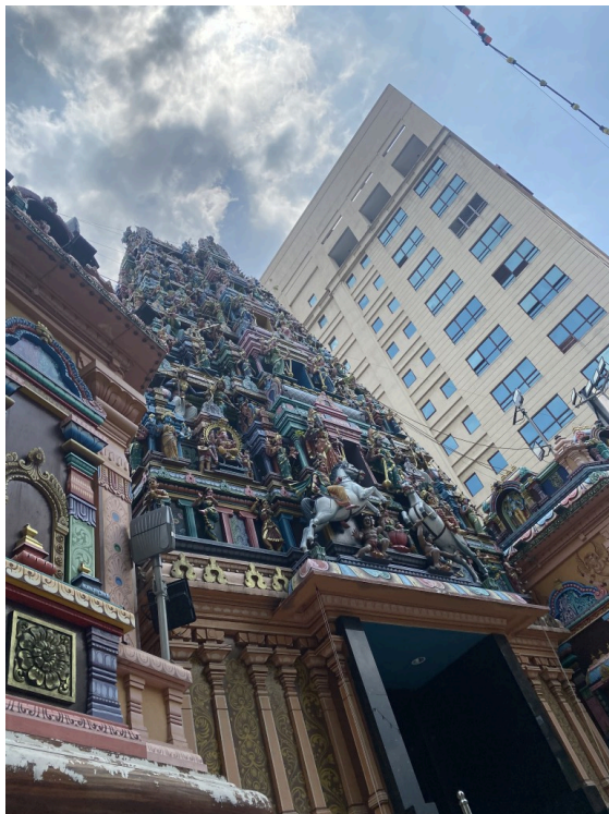
斯里玛哈马廉曼兴都庙，一般通过印度寺庙。