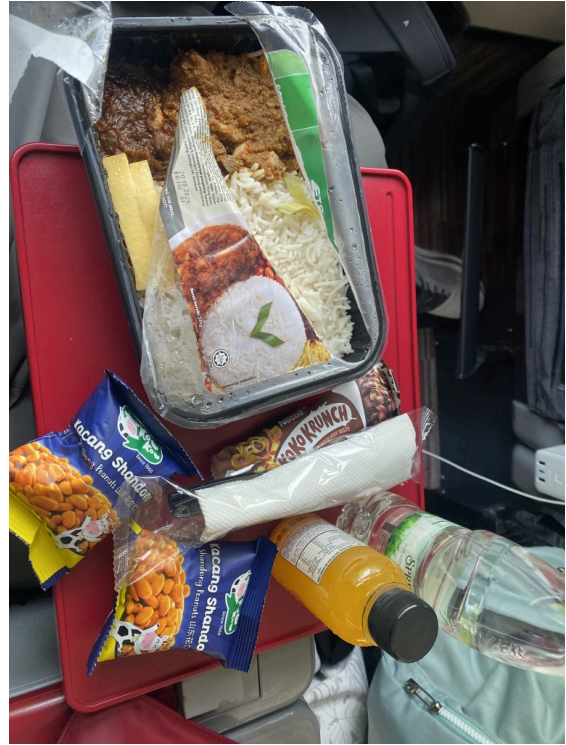
车上送的饭，很辣。饮料不仅送了水还送了橙汁。“山东花生”每人两袋。除此之外还有一个pandan蛋糕+tea/coffee当早饭。我以为是拉茶（teh tarik），结果就是普通的红茶茶包。

乘坐体验其实一般般，在130km/h的高速行驶下摇晃还是有一些的，而且噪音一直不小。在途中常常会有限速区间，不知道为什么就限速到50KM/H甚至更低。另外，车上每个人是有一个娱乐设备的，但是只能访问一个空空如也的车上商店和浏览器啥的，没什么太大的价值。但是商务座只比普通座位+110RM，座椅变舒适了不谈还送你早午饭，实属性价比超高。