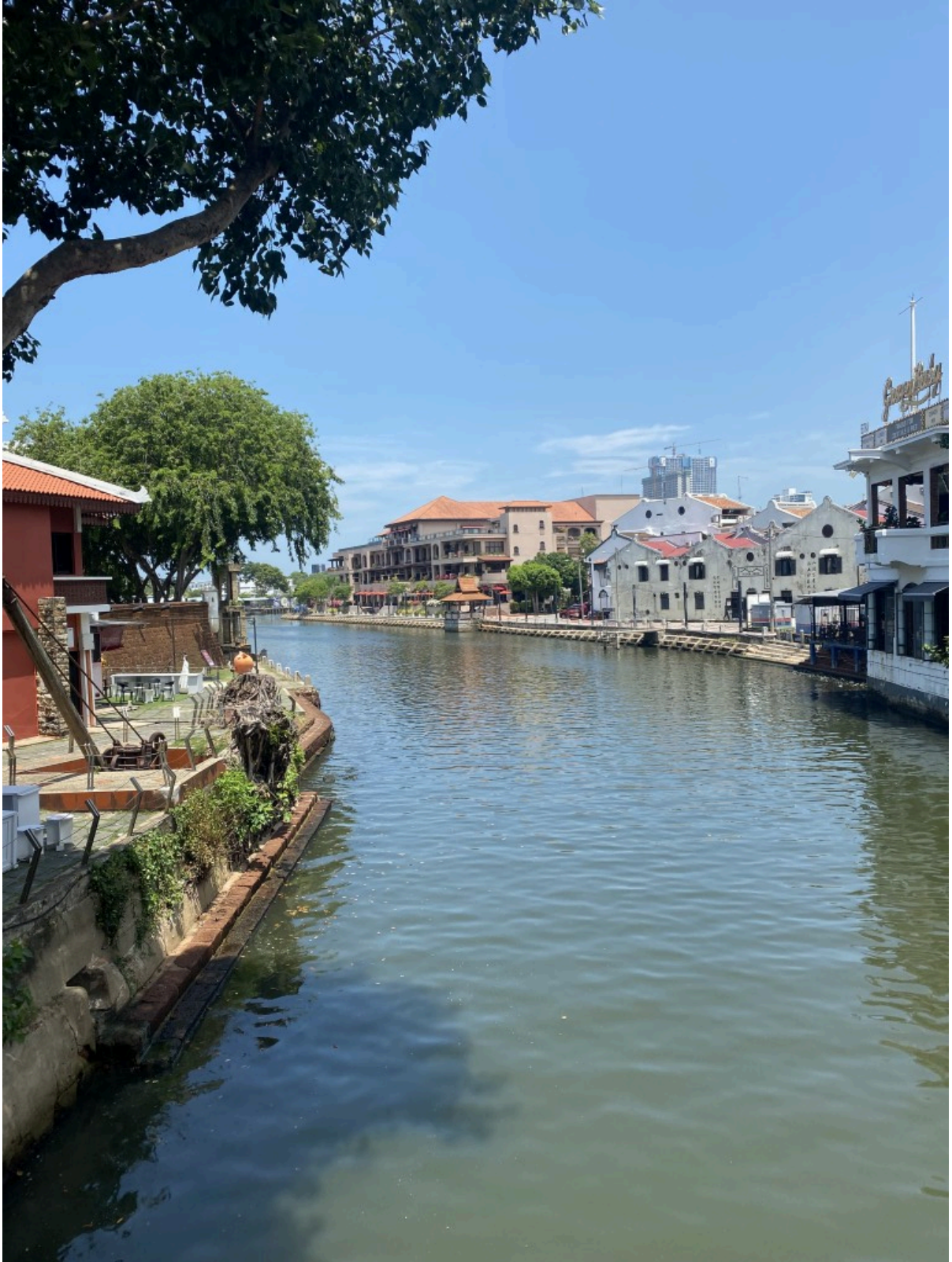
马六甲河（白天的样子）