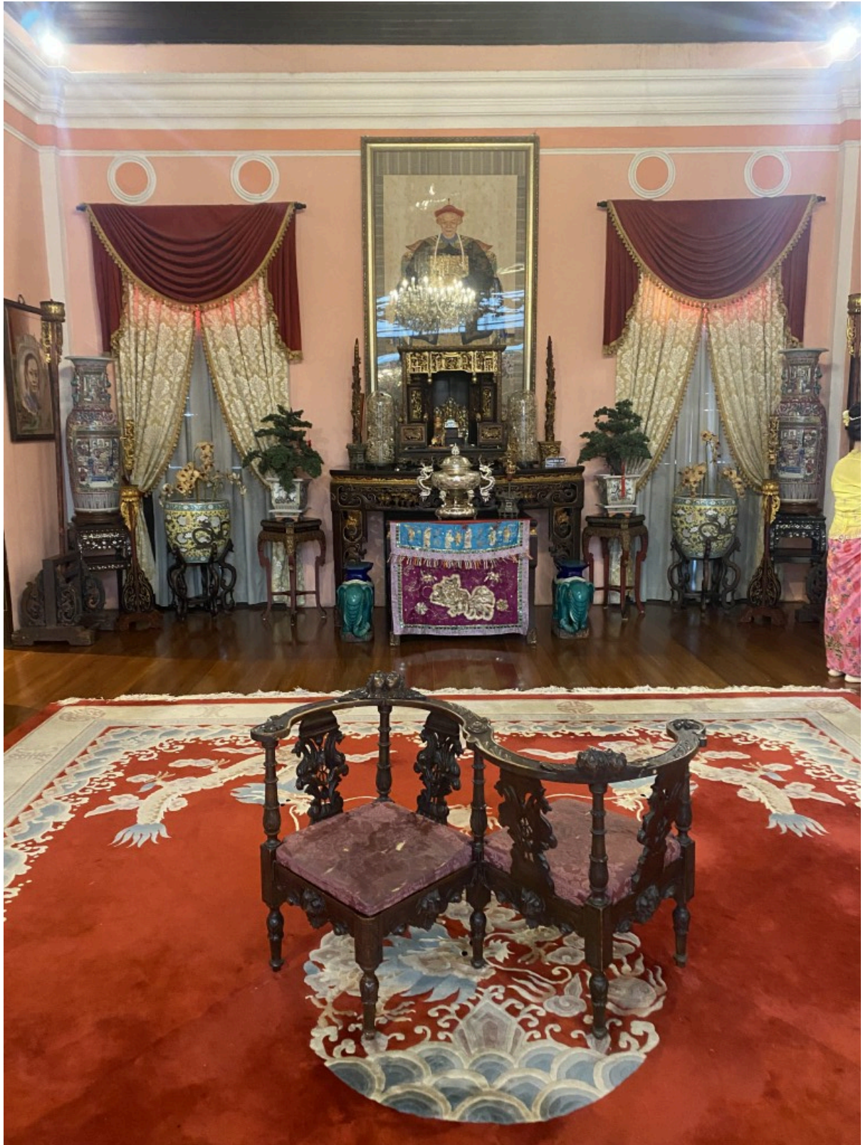
这种独特的椅子叫“鸳鸯椅”，用于谋划婚事时使用