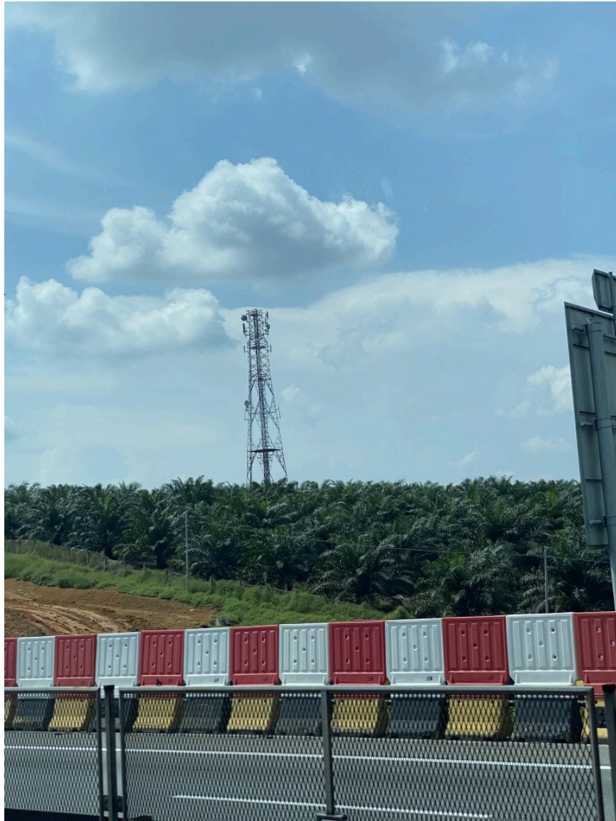
在路上能看到许多这种密集的热带经济林。ChatGPT说是油棕树。