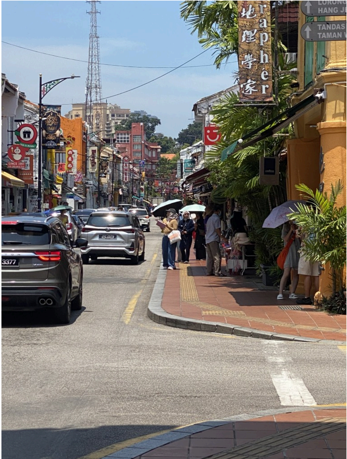
鸡场街，类似华人街？商业化程度很高，所以基本上就是走走看看。这种建筑很像民国时期的南方，骑楼古色古香。