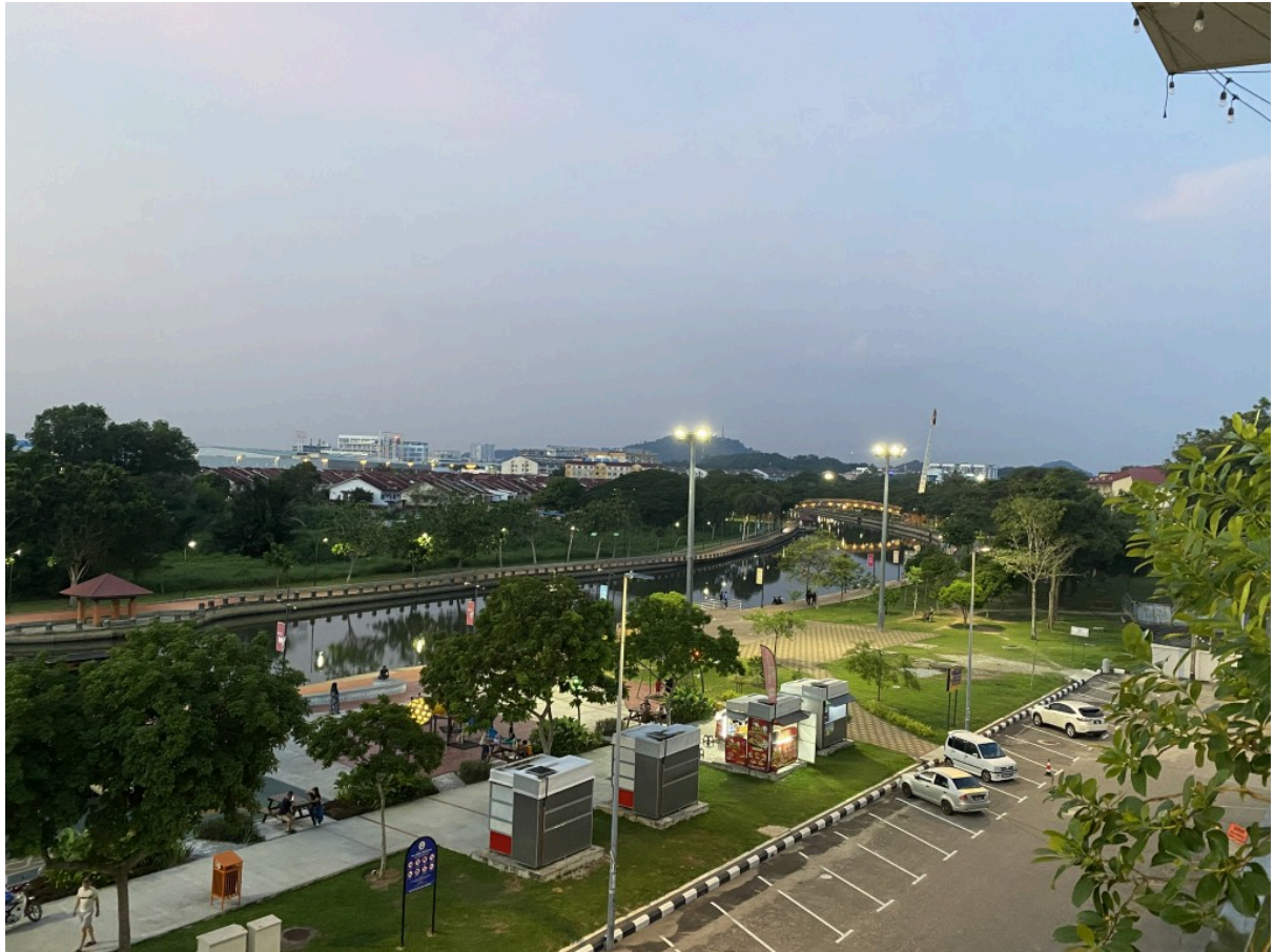
餐厅看到的马六甲河，类似市民公园一样，有点像秦淮河，感觉很休闲~