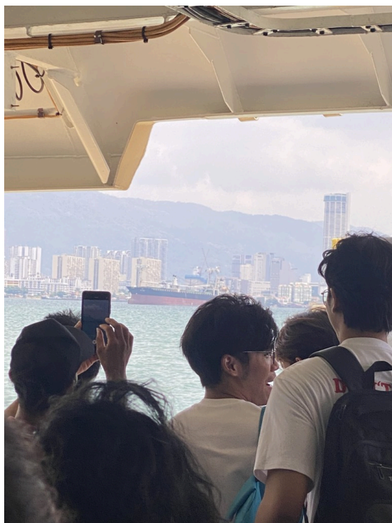
好位置都被占完了!